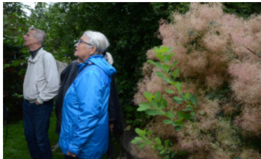
På spaning efter valnötter i det Japanska Valnötsträdet med ryggar mot den inmorlunda Perukbusken.

buffé på uteplatsen, och då kom solen fram som på beställning.