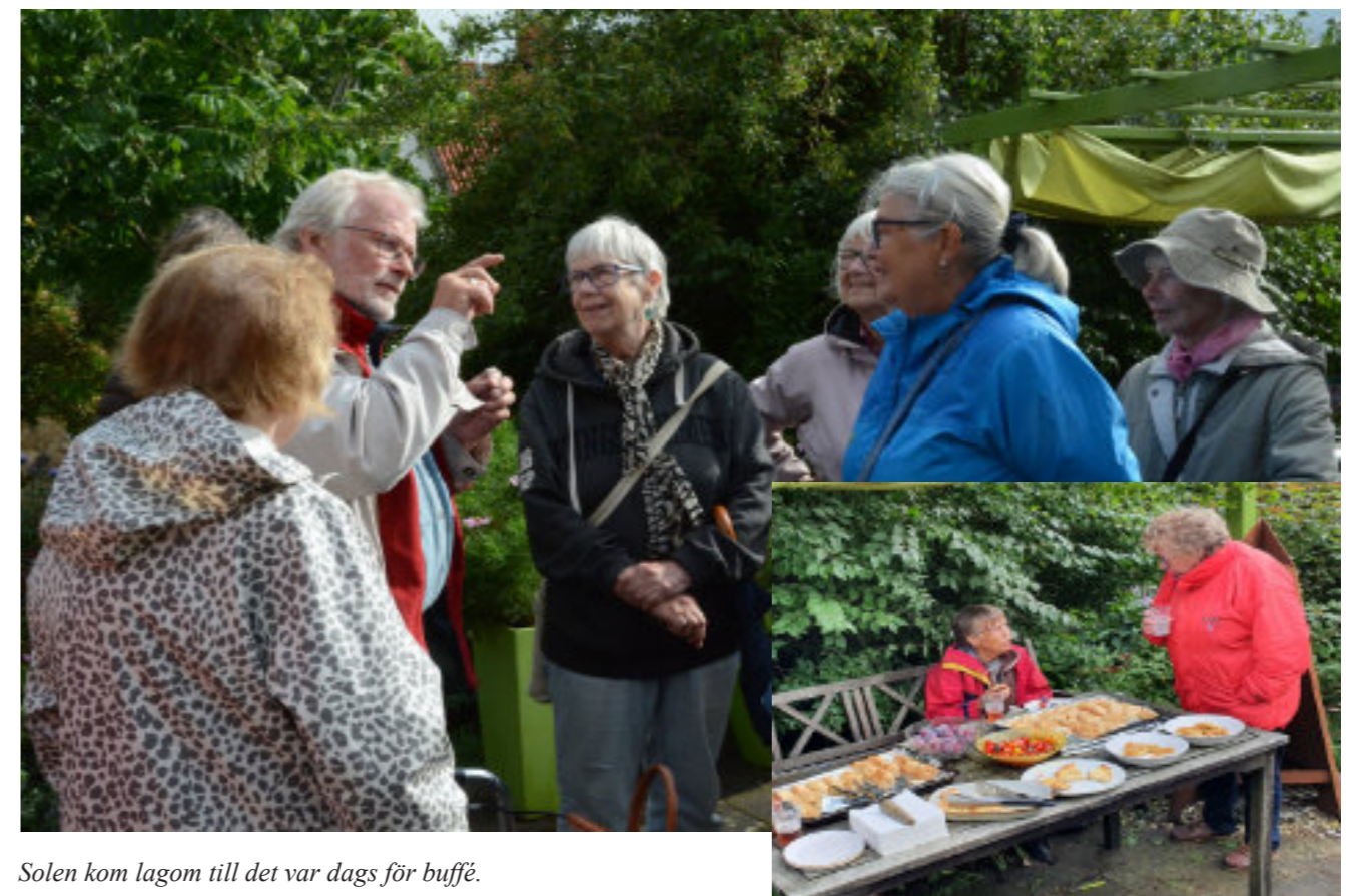
Solen kom lagom till det var dags för buffé.