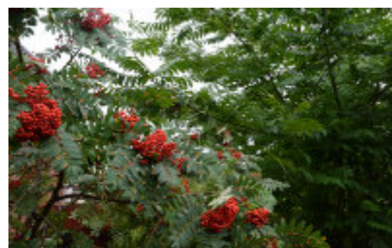
Till vänster: lysande rönnbär.